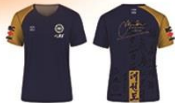
GM Trần souvenir t-shirt

MARRIOTT HOTEL TERMINAL, YUL AIRPORT HOSTED BY ART MARTIAUX ÉLÉMENTS 2 - 4 DÉCEMBRE 2022 www.elements-ma.ca/yul.iic