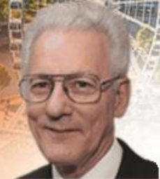
IDC International Do Course Special Guest